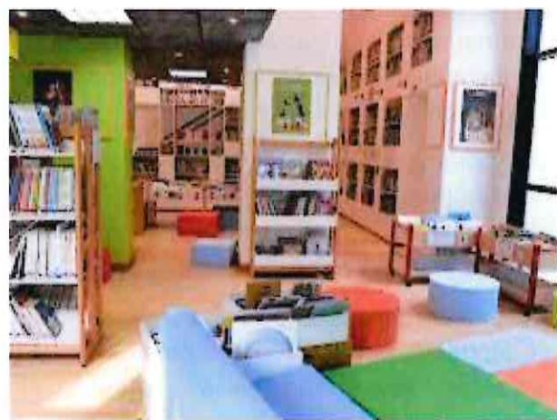
A droite et à gauche : médiathèque de Feignies