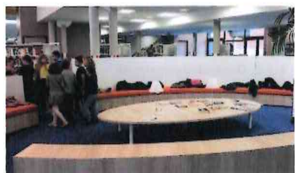
A droite et à gauche : médiathèque d'Aulnoye Aymeries