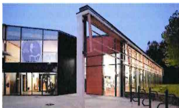
Médiathèque George Sand - Louvroil