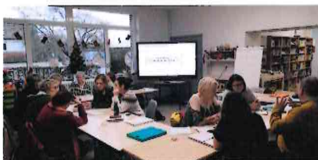
Réunion du groupe de travail réseau – décembre 2023

Leur circulation est soumise aux mêmes règles de fonctionnement que les documents propriétés des communes.