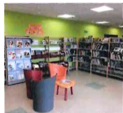
A droite et à gauche : bibliothèque de Boussois